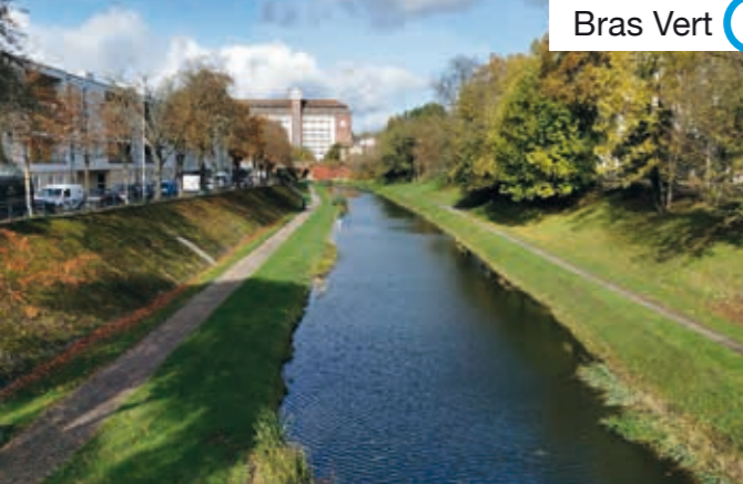
Bras Vert 1