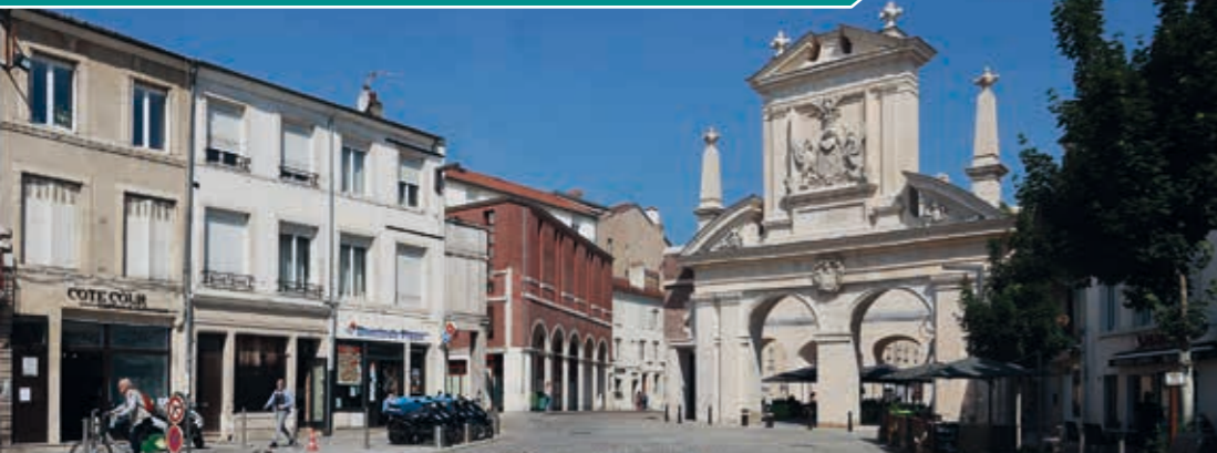
1 Porte Saint-Nicolas