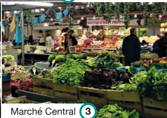
3 Marché Central