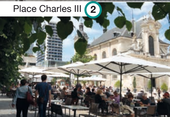
2 Place Charles III